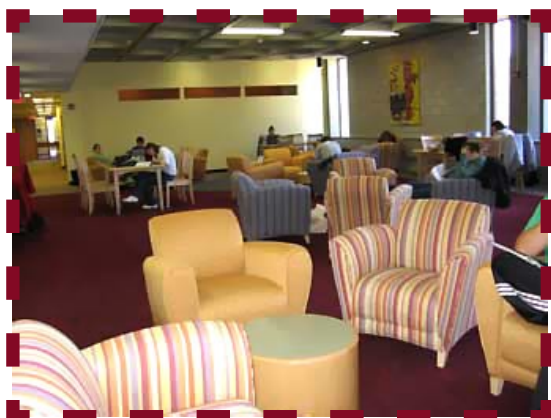
Bridgewater State College Des sièges bien confortables.

Cafétérias et autres espaces de détente. La possibilité de boire et de manger sur le campus peut certes paraître accessoire aux yeux de beaucoup, mais la présence d'une cafétéria et de lieux de détente confortables fait partie intégrante du modèle du centre de ressources documentaires et pédagogiques. Si l'on encourage les étudiants à passer plus de temps dans des lieux conçus pour leur permettre de mener leurs recherches du début à la fin, il est normal de leur donner la possibilité de faire de courtes pauses qui seront autant d'occasions d'échanges sociaux.