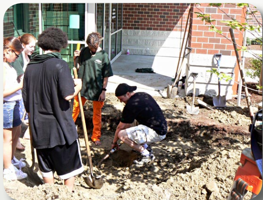
Des étudiants aménagent l'espace qui accueillera la statue du « Théâtre dynamique », à l'entrée du Centre médiatique et artistique du campus de Public Street .

Le Met est bien plus qu'une école : c'est également un centre dans lequel les membres de la communauté peuvent prendre part aux activités pédagogiques quotidiennes. Son campus de Public Street , au sud de la ville de Providence, est équipé d'un centre médical destiné aux adolescents, mais aussi d'un centre de remise en forme et d'un centre médiatique et artistique.