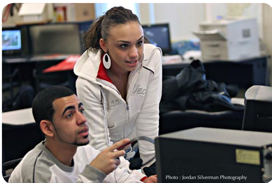
Étudiants de l'école « Met »