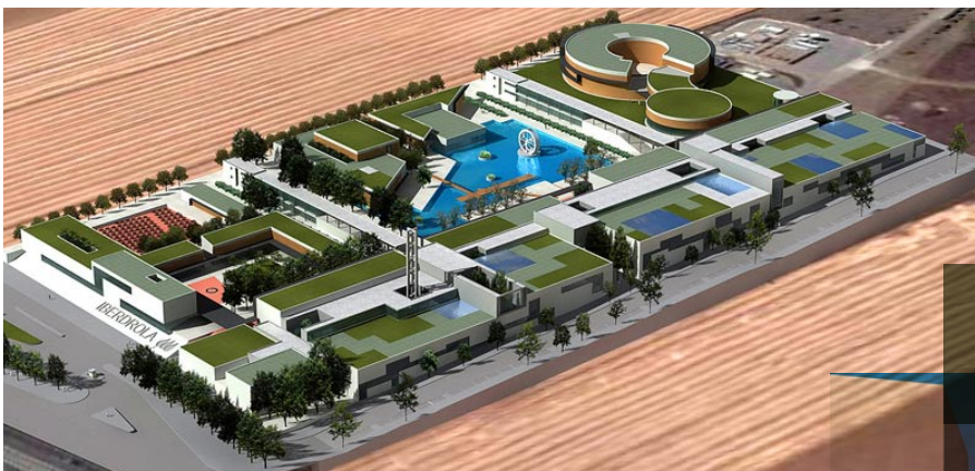
Vue globale depuis l'est